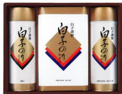
2150 3,000円(税込3,240円)★ 白子海苔・茶漬け詰合せ (BS-30A2)

●内容: 焼海苔12袋(8切×5枚)、焼海苔2袋(半裁×8枚)、海苔茶漬け×10袋 ●箱サイズ: 240×320×80mm ●重量: 640g