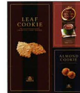
2914 2,500円(税込2,700円)★ ココア・クッキーセット (PF208)

●内容: AGFブレンドレギュラーコーヒー(ドリップタイプ×3袋)、トワイニング紅茶×10袋、モロゾフ抹茶クッキー×5個 ●箱サイズ: 273×230×45mm ●重量: 316g