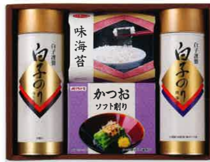
2169 3,000円(税込3,240円)★ 白子海苔詰合せ (BA-30MA)

●内容: 焼海苔12袋(8切×5枚)、海苔茶漬け×10袋、味海苔6袋(8切×5枚)、マルトモかつお削り(2g×5袋) ●箱サイズ: 240×320×80mm ●重量: 720g