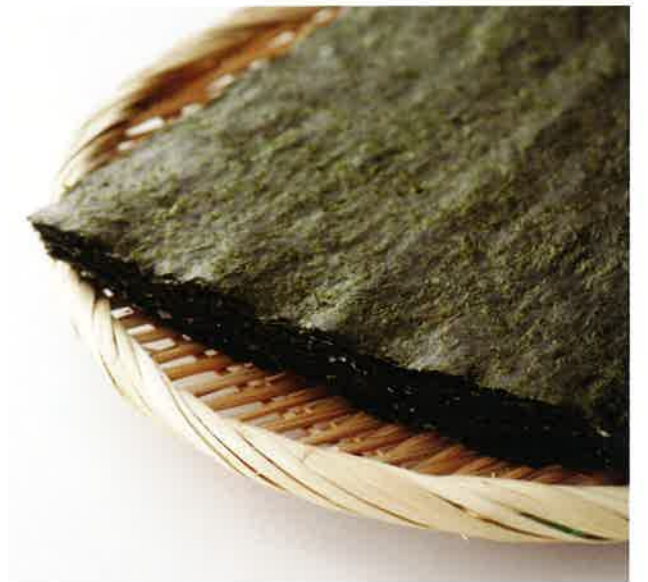
2209 2,500円(税込2,700円)★ 江戸前ちば海苔3帖セット(CN-5B)