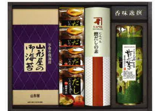
2619 5,000円(税込5,400円)★ 焼海苔・鰹だしの素・深蒸し煎茶・ スープギフト(MT-F)