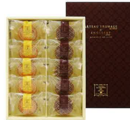
2911 2,000円(税込2,160円)★ ラ・マーレ・ド・チャヤ ケーキセット (TCN-A)