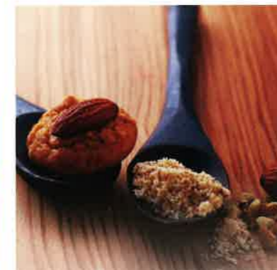
モロゾフ アルカディア 卵白で仕立てた軽やかな生地に ローストナッツをたっぷり練り込んで サクサクとした食感に焼き上げました。 モロゾフが誇る ロングセラーの味です。