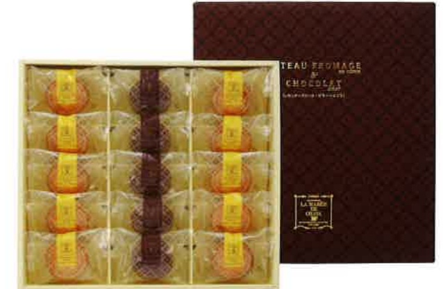
2912 3,000円(税込3,240円)★ ラ・マーレ・ド・チャヤ ケーキセット (TCN-CJ)