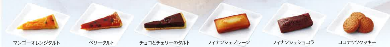
マンゴーオレンジタルト