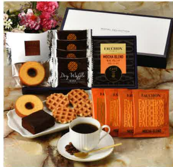
2640 2,000円(税込2,160円)★ スイーツ&フォションコーヒーギフト (FBO)

1886年創業以来、 パリ マドレーヌ広場で美味追及の姿勢を守る 世界の美食トップブランド「フォション」。 パリ、フランスはもとより、 世界のグルメの称賛を浴び、 「現代的でデラックスな食ブランド」として 100年以上の歴史を誇ります。