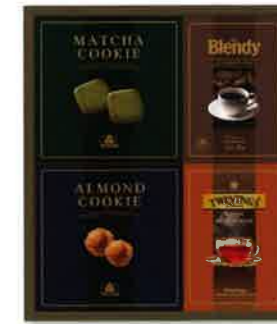
2915 3,000円(税込3,240円)★ コーヒー・紅茶・クッキーセット (P4701)

●内容: バンホーテンココア×3袋、モロゾフアルカディア70g、モロゾフファイヤージュ×5個 ●箱サイズ: 262×215×46mm ●重量: 366g