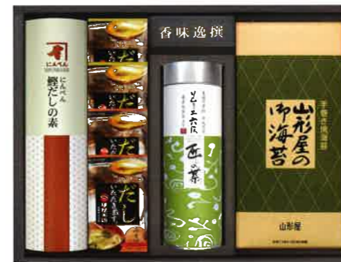
2618 4,000円(税込4,320円)★ 焼海苔・鰹だしの素・深蒸し煎茶・ スープギフト(MT-E)