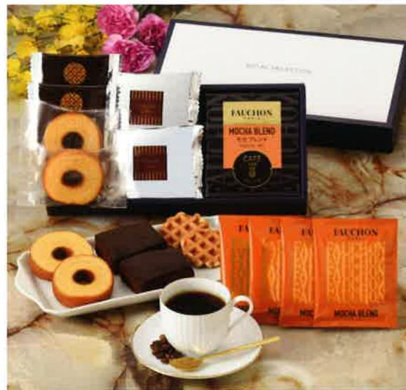
2641 2,500円(税込2,700円)★ スイーツ&フォションコーヒーギフト (FBEA)