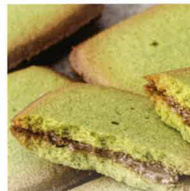
モロゾフ 抹茶クッキー 愛知県西尾の抹茶を使用した 香り豊かな生地、上品な甘さの 小倉あん風味のクリームをサンド。 さくとした食感の お濃茶クッキーです。