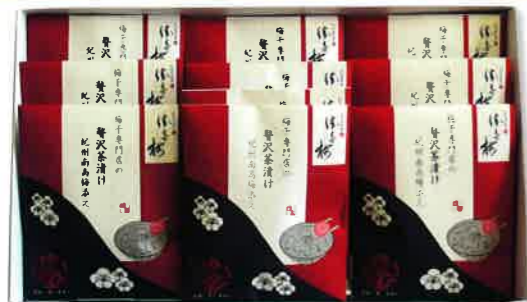
2093 2,500円(税込2,700円)★ 勝徳梅 贅沢茶漬け南高梅添え (SU-25D)

●内容: お茶漬け5g×10袋、紀州産南高梅(個包装)×10粒 ●箱サイズ: 220×360×55mm ●重量: 約488g