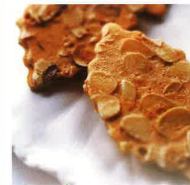
モロゾフ ファイヤージュ 木の葉のように薄く繊細なクッキーに スライスナッツをぎっしりしきつめて パリッと香ばしく焼き上げました。 3種類のチョコレートサンドした 贅沢な味わいです。