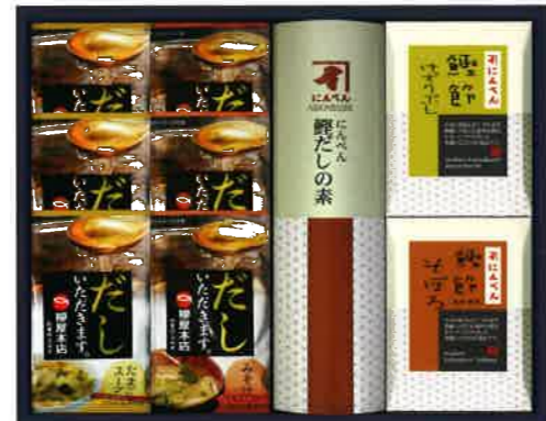
2639 3,000円(税込3,240円)★ 鰹節削り節・鰹だしの素・鰹節そぼろ・ スープギフト(M-C)