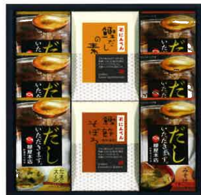
2647 2,500円(税込2,700円)★ 鰹だしの素・鰹節そぼろ・スープギフト (M-B)