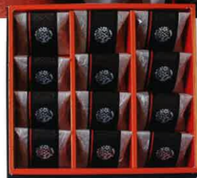
2078 3,000円(税込3,240円)★ 勝徳梅 梅干詰合せ (SU-30)

●内容: 紀州産南高梅はちみつ仕立て(個包装)×12粒 ●箱サイズ: 243×236×55mm ●重量: 約540g