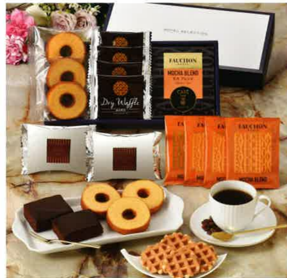
2642 3,000円(税込3,240円)★ スイーツ&フォションコーヒーギフト (FCO)