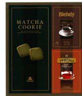
2913 2,000円(税込2,160円)★ コーヒー・紅茶・クッキーセット (P4711)

●内容: AGFブレンドレギュラーコーヒー(ドリップタイプ×3袋)、トワイニング紅茶×10袋、モロゾフ抹茶クッキー×5個 ●箱サイズ: 273×230×45mm ●重量: 316g