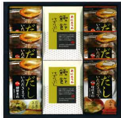
2646 2,000円(税込2,160円)★ 鰹節削り節・スープギフト (M-A)

焼津産かつお節を使用。 かつおだしのうま味と香りが味わえるフリーズドライの味噌汁と たまごのふんわりした食感とかつおだしのうま味・香りが味わえるたまごスープです。